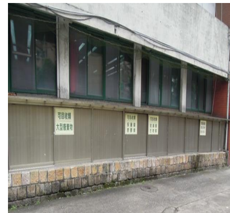
一般事業廢棄物暫存區